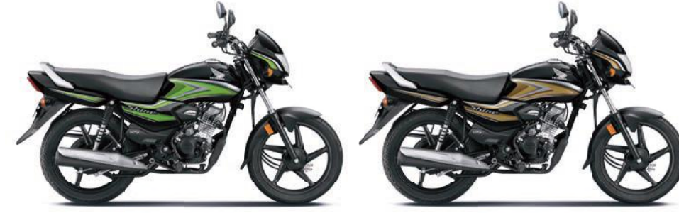
ग्रीन के साथ ब्लैक गोल्ड के साथ ब्लैक