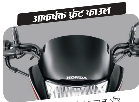
आकर्षक फ्रंट काउल

टैंक के साथ साइड ग्राफिक्स की खूबसूरती बढ़ाए आपकी शाइन।