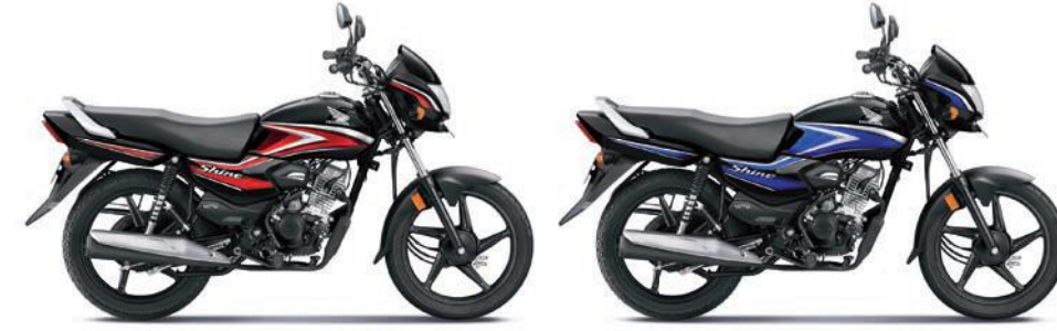
रेड के साथ ब्लैक ब्लू के साथ ब्लैक